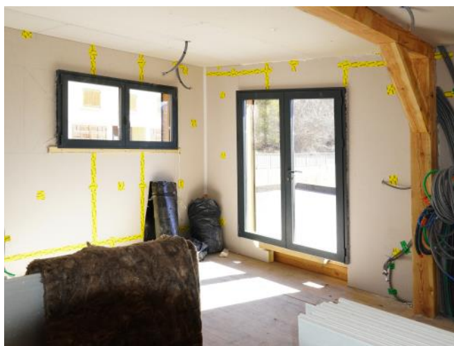
Crêtes de Peyrolles

Si ce projet peut aujourd'hui voir le jour, c'est grâce à vous. Merci du fond du cœur à tous les donateurs et donatrices et à toutes les personnes qui ont relayé la campagne autour d'elles.