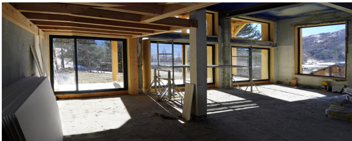
L'auberge de l'Écrin

Peut-être le savez-vous déjà, l'Écrin sera découpé en plusieurs espaces de vie, chacun portant un nom emblématique de nos montagnes. Découvrez sans plus attendre le nom de plusieurs pièces sous les photos !