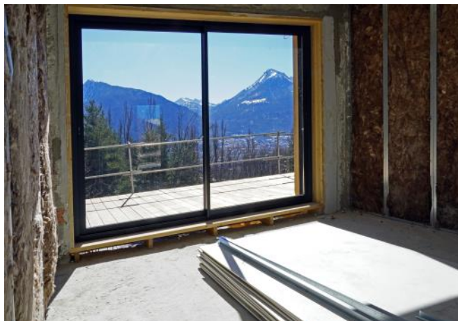
Brèche des trifides

Merci à celles et ceux qui nous ont permis de remporter la première place en votant pour nous. Grâce à ce prix, nous allons financer une partie de l'aménagement intérieur de l'Écrin 82-4000.